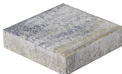
Luserna con bianco