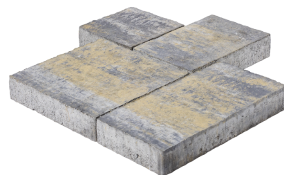
Luserna con bianco